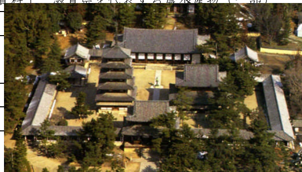
資料1 滋賀県を代表する農水産物（一部）

基本 ①資料1の農産物をつくる農家の多くは、他の仕事もしている。このような、農業以外にも仕事を持っている農家を何というか、書きなさい。